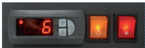
Control panel Tableau de contrôle