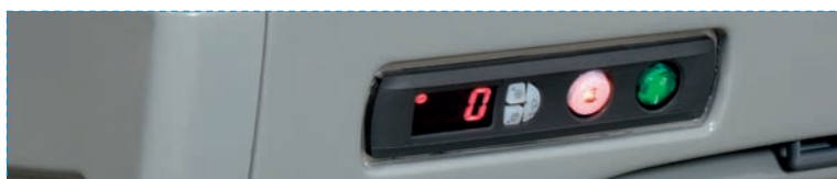
Control panel Tableau de contrôle