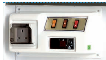
Control panel Tableau de contrôle